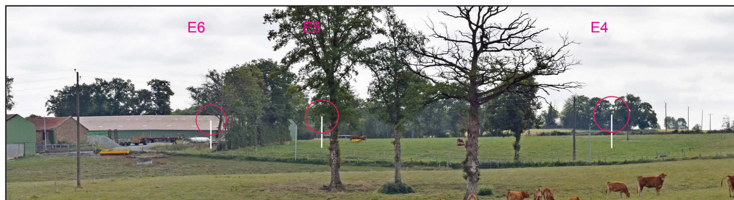
Esquisse (zoom facteur x 2)