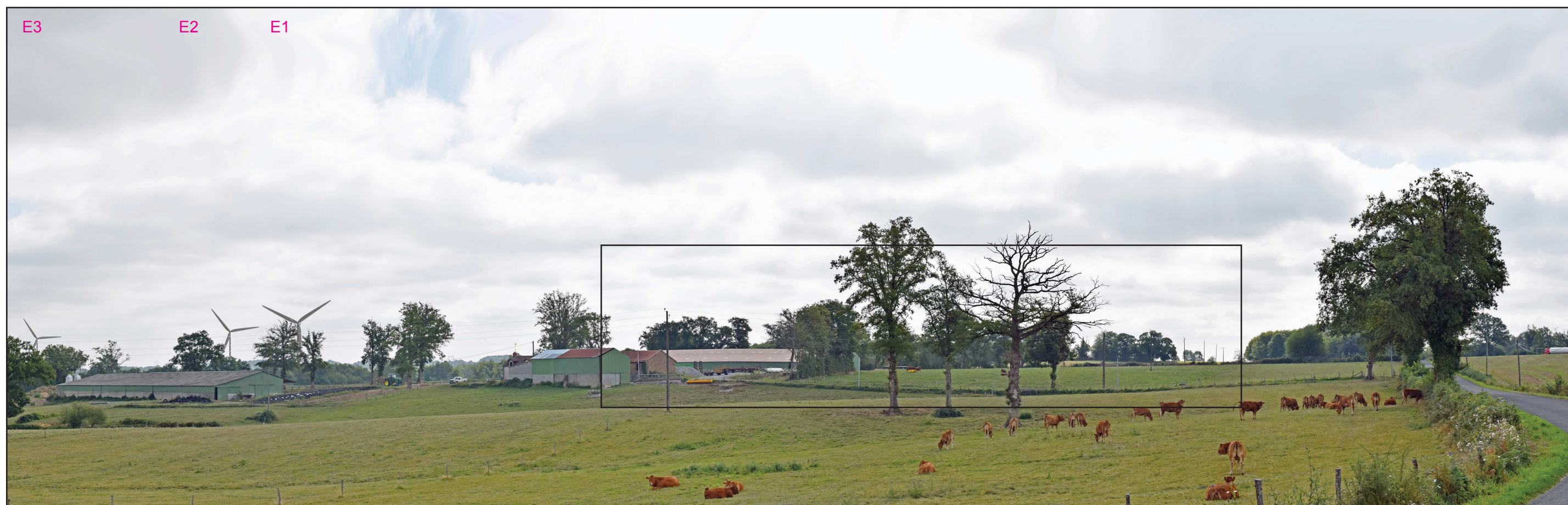
Vue réaliste photomontée (angle de vue 80°)

Le photomontage doit être observé à une distance de 24 cm pour correspondre à une vue réaliste (impression A3)